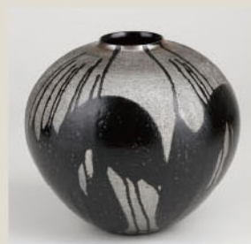
篠原雅士「黒釉掛け流し壺」個人蔵