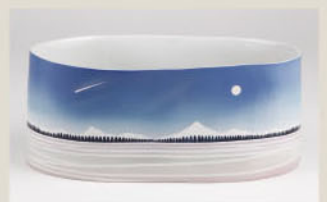
永田公道「大地の響き」