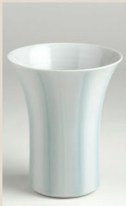
二宮好史「釉象嵌花器」