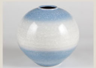
山田公夫「結晶釉壺」