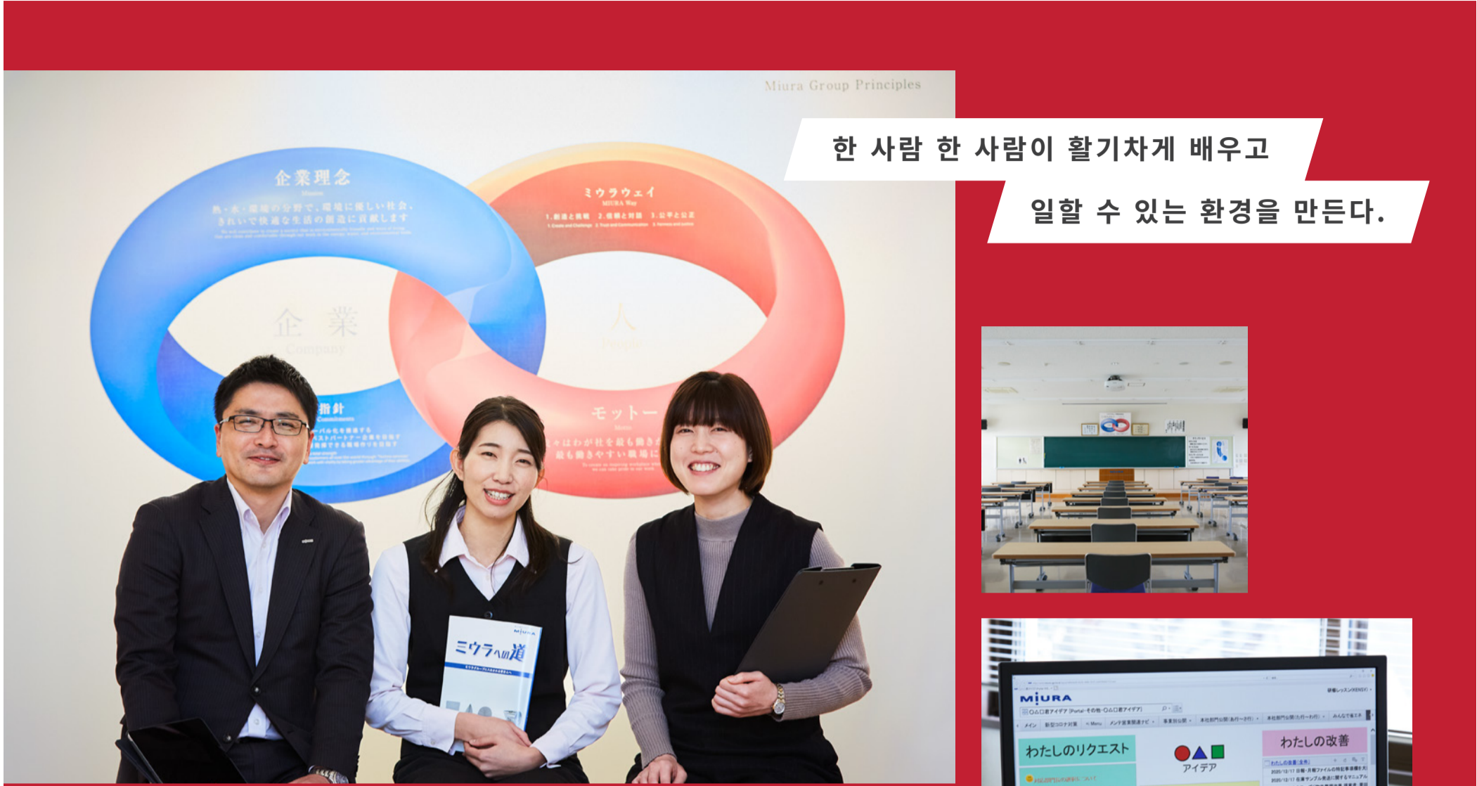
Miura Group Principles