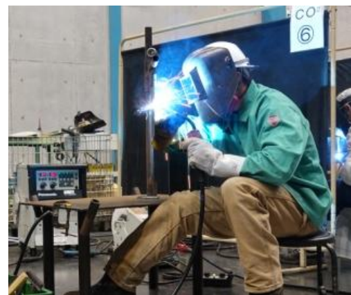
▲ミウラグループ溶接コンクールの様子