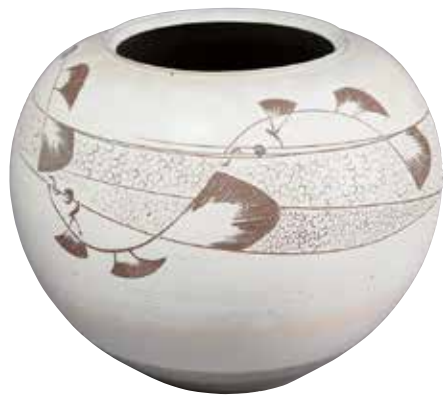
山田雅之《播落魚文壺》