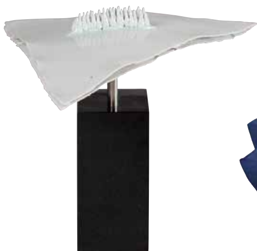
和田毅《白い景色のそのなかで》