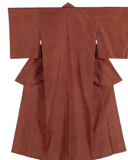
野本久美《草木染紬織着物(仮仕立て)“かりんの詩”》