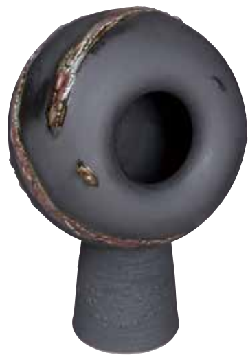
芥川正明《ブラックホールのイメージ》(部分)