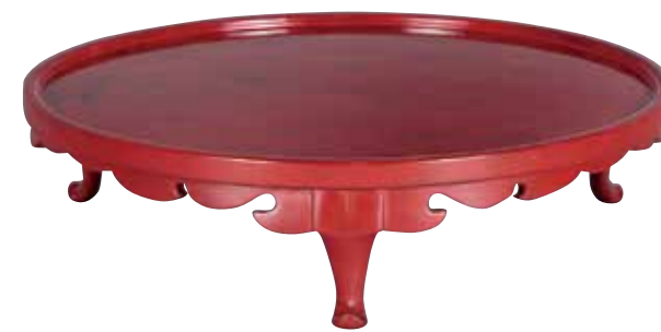
兒玉高次《根来足付盤(丸)》