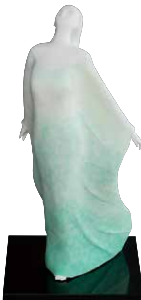
赤松絵里《風の翼に乗って》