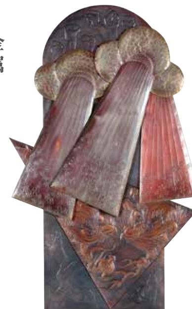
井上文子《まつり-恵みのあめ》