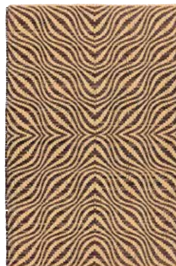
松田竹二郎《花網代Ⅲ》