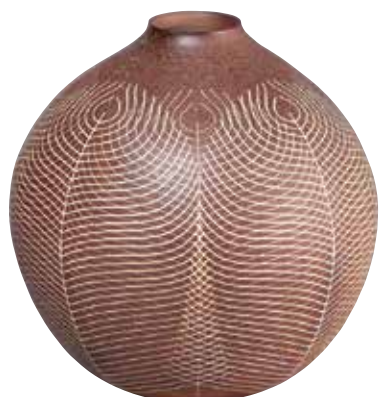
篠原雅士《焼締象嵌壺》