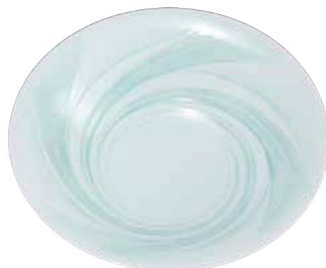
二宮好史《釉象嵌線文鉢》