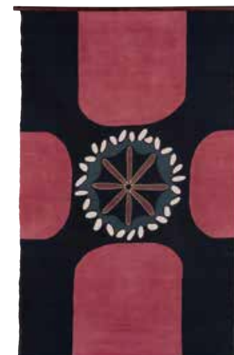
宇野貴美恵《赤い芥子》