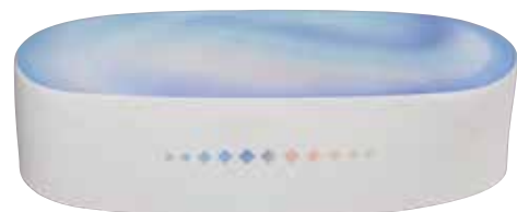
永田公道《宇宙の彼方へ》