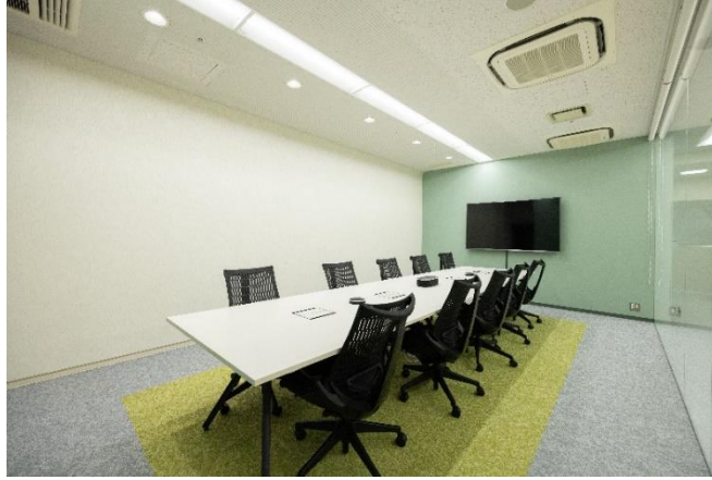
▲ミーティングルーム

ショールームやラボラトリーにご案内したお客様との商談や、社内の教育・研修等で活用できるスペースとしてミーティングルームを併設しています。また大人数に対応したラウンジもご利用いただけます。