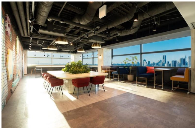
▲大人数での利用可能なラウンジ(アクアリアタワー内エリア)

ミウラグループでは、「熱・水・環境の分野で、環境に優しい社会、きれいで快適な生活の創造に貢献します」という企業理念のもと、今回のメディカル横浜ラボの新設によって、お客様への更なるサービス向上と、医療分野の発展に貢献したいと考えています。