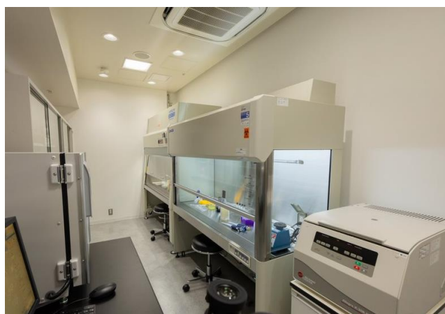
▲ラボラトリー内の検査機器

※1 HCPT : Human Cell-based Pyrogen Test (ヒト細胞を利用した発熱性物質試験)